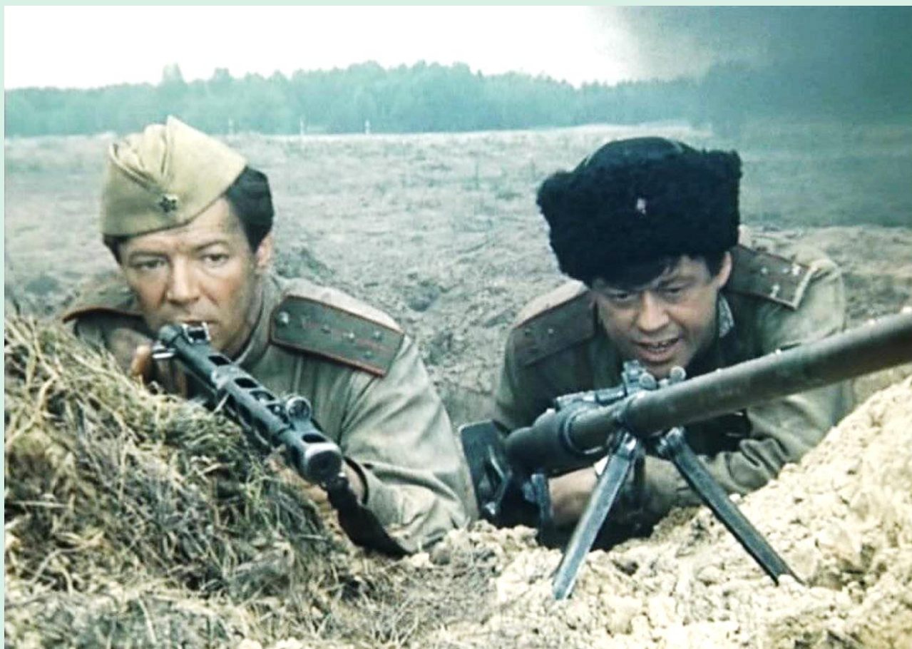
Кадр из кинофильма «Батальоны просят огня» (Россия, 1985)

Писатель-фронтовик Юрий Бондарев выпустил книгу «Батальоны просят огня», посвященную событиям, без которых освобождение Киева 6 ноября 1943 года не стало бы возможным. Речь идет о форсировании Днепра и удержании плацдармов, стоивших огромных потерь.