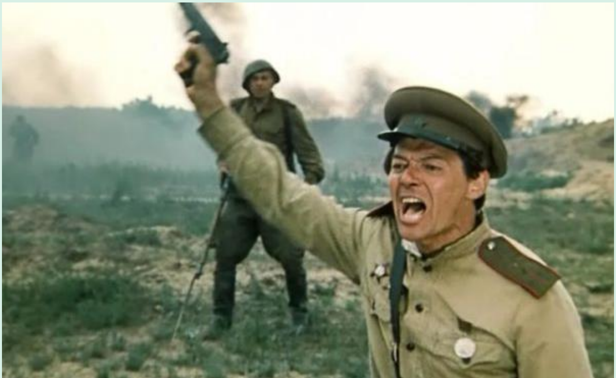
Кадр из кинофильма «Батальоны просят огня» (Россия, 1985)

«Война для меня – святое, великое действие, через которое прошла наша страна. И прошла достойно. Меня порой упрекали: «Почему у вас все герои погибают?» Да потому что из нашего поколения ушло на войну 99%, а вернулось 3%...»