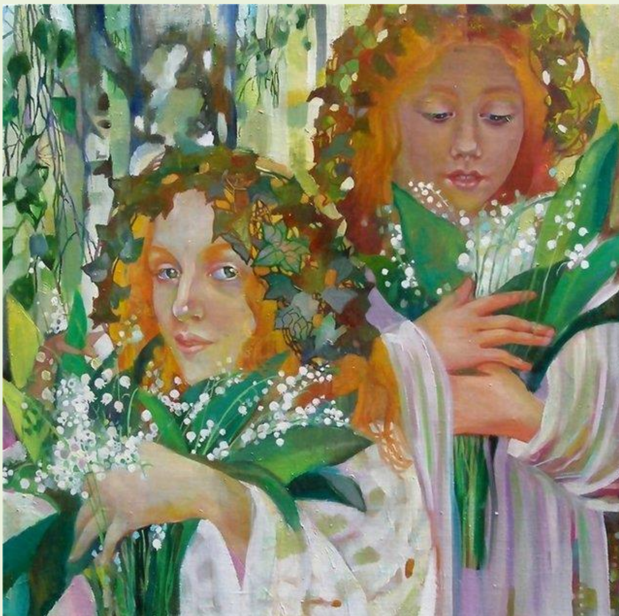
Ф. Зубков. «Майские ангелы»

Ландыши – символ России, нежный и хрупкий, но хранящий в себе глубокие исторические корни. Этот скромный цветок, распускающийся в тени русских лесов, на протяжении веков вдохновлял поэтов, художников и композиторов, становился частью народных поверий.