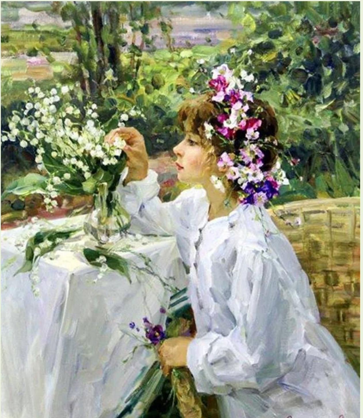
Е. Сальникова. Фрагмент картины «Весна»

В русской поэзии ландыш часто ассоциируется с женским образом: тихим, светлым, благородным. Он противоположен ярким, пышным цветам. В его скромности – достоинство. В его кратком цветении – напоминание о том, что прекрасное не вечно, и поэтому особенно ценно.