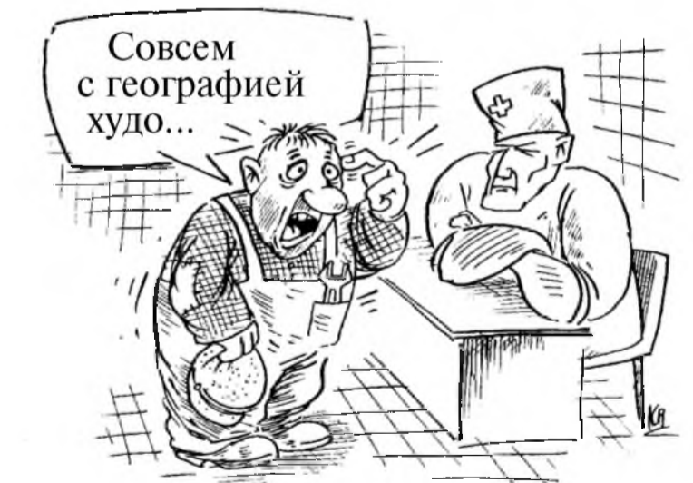
Рисунок Владимира Кремлева

Особо отмечу, что Нагорный Карабах является неотъемлемой частью Азербайджана. И компании, которые на своих сайтах оспаривают это, мягко говоря, не уважают территориальную целостность нашей страны. А это, конечно же, повлечет адекватные