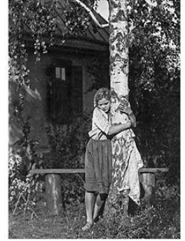
Мамина берёза. На съёмках кинофильма «Дочь партизана». 1934 г.