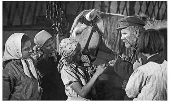
На съёмках кинофильма «Дочь партизана». 1934 г.