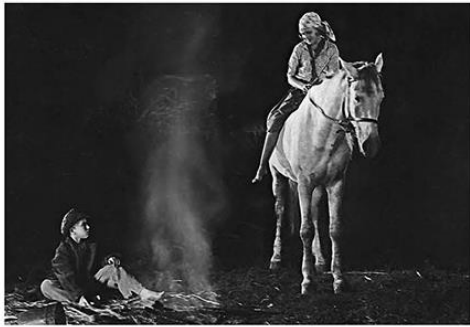
На съёмках кинофильма «Дочь партизана». 1934 г.