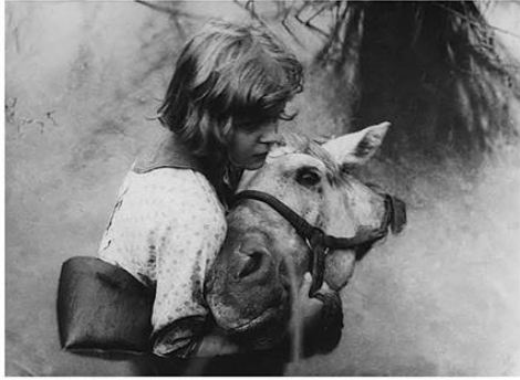
На съёмках кинофильма «Дочь партизана». 1934 г.