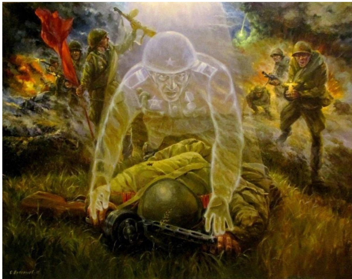
С. Бессонов. «Душа солдата»

Многие эпизоды в романе – гимн солдатскому героизму. Они раскрывают это качество как обычное каждодневное проявление сущности советского русского человека на войне. Автор говорит о величии народного подвига, силе человеческого духа, страданиях, которые пришлось пережить советским людям, о страшной кровавой цене победы.