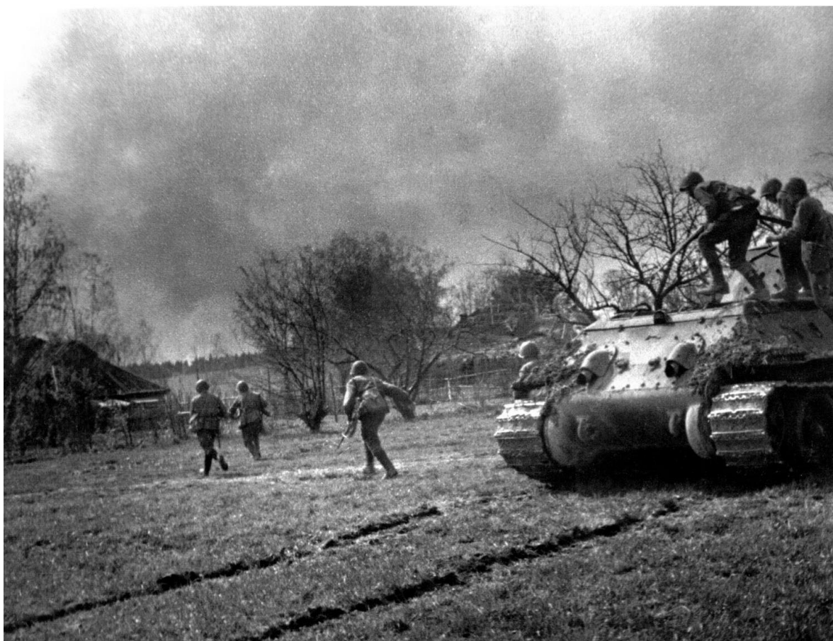
Высадка десанта в населенном пункте. Смоленская область, район г. Ельни. Август. 1941 г.

Не страшно под пулями мертвыми лечь, Не горько остаться без крова, И мы сохраним тебя, русская речь, Великое русское слово. Свободным и чистым тебя пронесем, И внукам дадим, и от плена спасем Навеки!