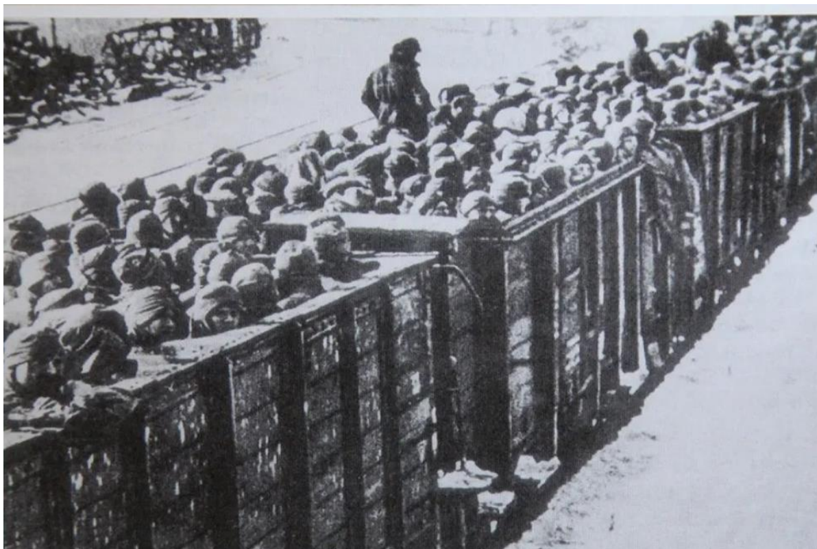
Поезд с советскими военнопленными. октябрь 1941 года. Копия фотографии, сделанной немецкими офицерами, экспонат музея «Богородицкое поле».

ток прорыва удалось выйти лишь небольшой части советских войск. Остальные либо погибли, либо были взяты в плен.