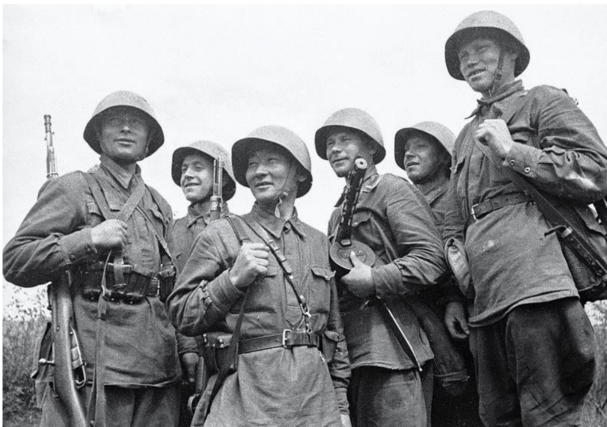
Военнослужащие Красной армии под Смоленском.1941