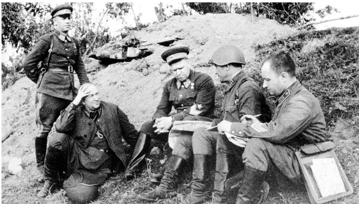
Г.К. Жуков под Ельней. 1941