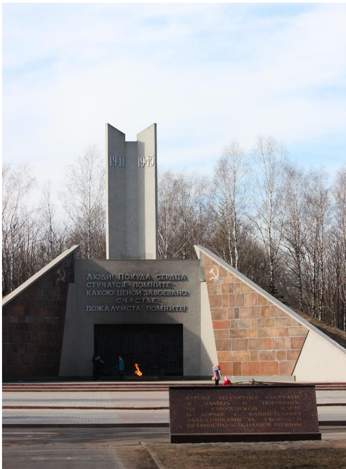
Город Смоленск. Курган бессмертия

В 1961 году в журнале «Юность» было опубликовано пронзительное произведение молодого талантливого поэта Роберта Рождественского «Рек-