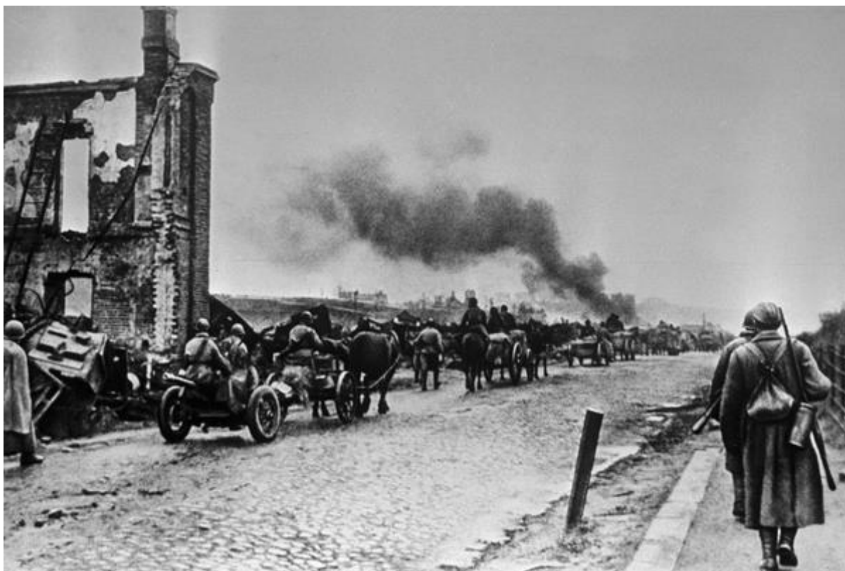
Красная армия вступает в Ельню

Четырём стрелковым дивизиям СССР — 100-й, 127-й, 153-й и 161-й — «за боевые подвиги, за организованность, дисциплину и примерный порядок» были присвоены почётные наименования «гвардейские», и они были переименованы и преобразованы в 1-ю, 2-ю, 3-ю и 4-ю гвардейские соответственно.